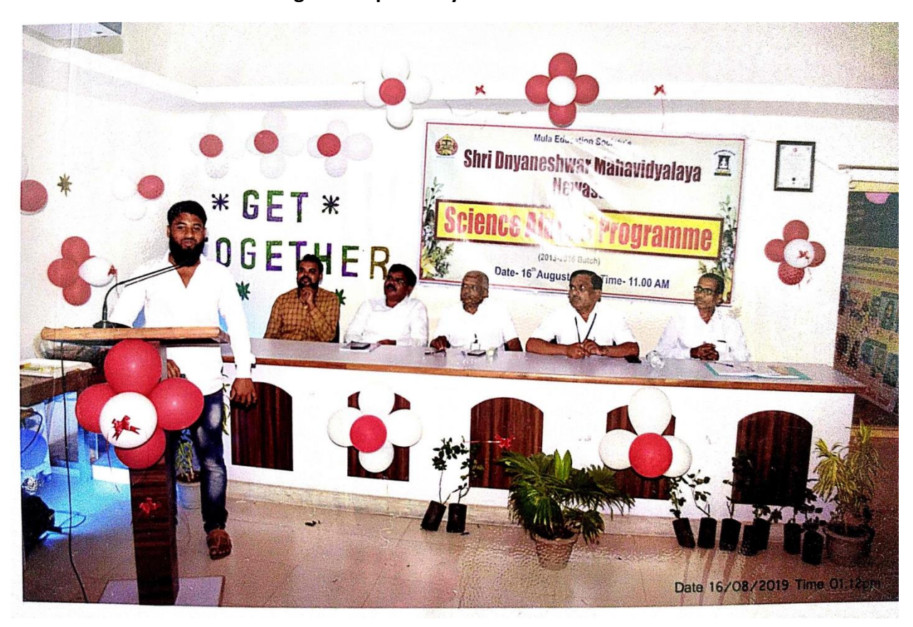
Figure 6: Speech by alumni 3