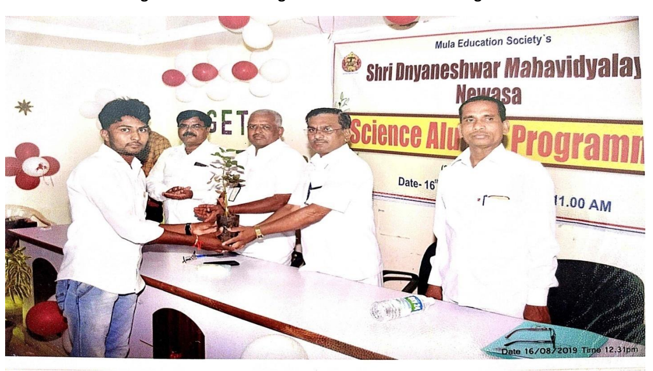
Figure 4: Speech by alumni student 1