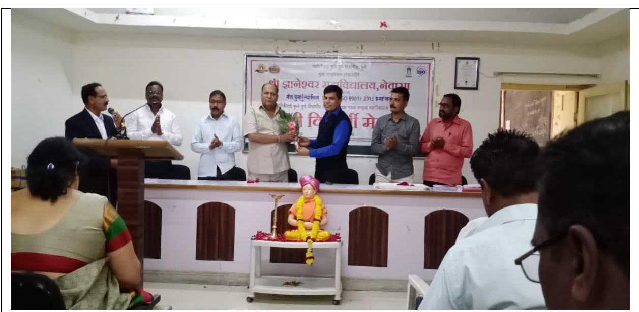
Alumni Meet of Arts Students 19 January 2020