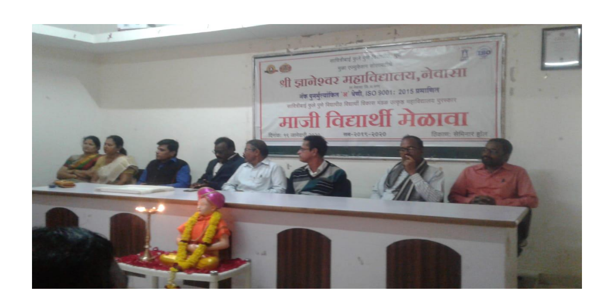
Alumni Meet of Arts faculty on 19th January 2020