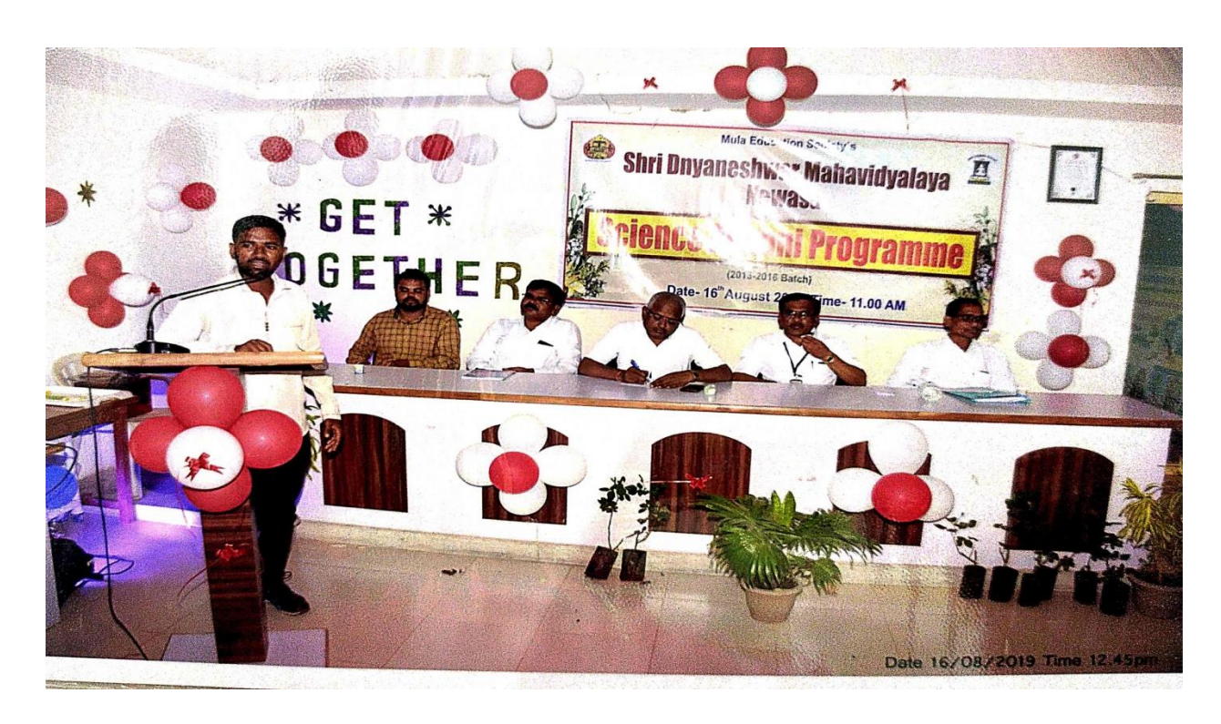
Figure 5: Speech by alumni student 2